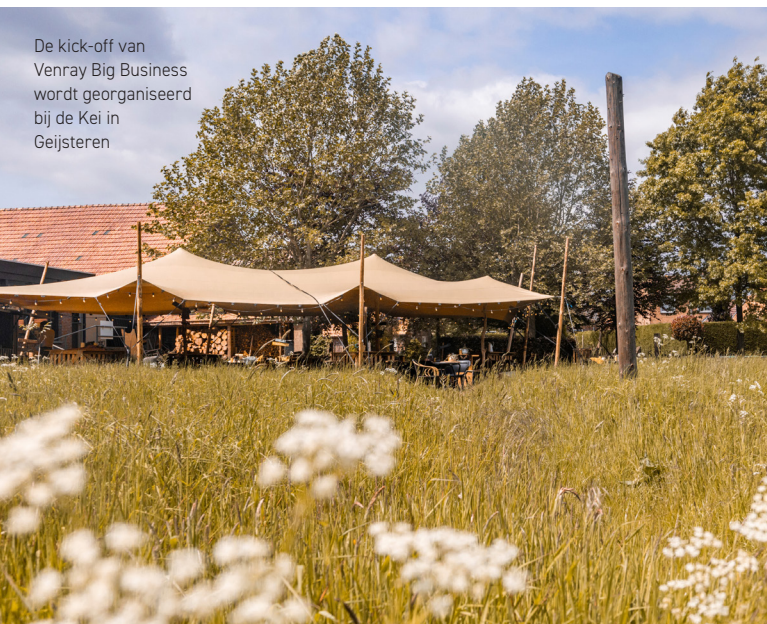
De kick-off van Venray Big Business wordt georganiseerd bij de Kei in Geijsteren